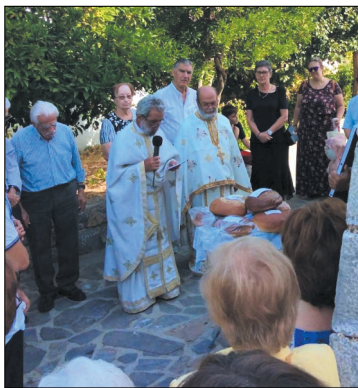
Στον Αφέντη Χριστό στον περίβολο του Σχολείου

νω Χωριό, η οποία υπήρξε και Καθεδρικός Ναός της ενορίας του Επάνω Χωριού, όταν στο χωριό μας υπήρχαν δύο ενορίες, του Επάνω και του Κάτω χωριού και η Παναγία η Κουνέλα στο Κάτω Χωριό. Και οι δύο εκκλησίες λειτουργήθηκαν και φέτος εναλλάξ, τόσο τις ημέρες από την πρώτη μέχρι τις 15 Αυγούστου, όσο και την ημέρα της εορτής.