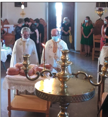
Δεκαπενταύγουστος στο Πάνω Χωριό στην Παναγία

νω Χωριό, η οποία υπήρξε και Καθεδρικός Ναός της ενορίας του Επάνω Χωριού, όταν στο χωριό μας υπήρχαν δύο ενορίες, του Επάνω και του Κάτω χωριού και η Παναγία η Κουνέλα στο Κάτω Χωριό. Και οι δύο εκκλησίες λειτουργήθηκαν και φέτος εναλλάξ, τόσο τις ημέρες από την πρώτη μέχρι τις 15 Αυγούστου, όσο και την ημέρα της εορτής.