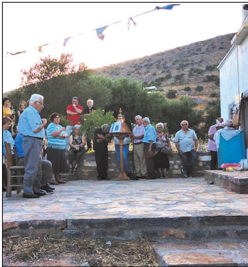
Στον Άγιο Παντελεήμονα στην λειτουργία ανήμερα της εορτής.