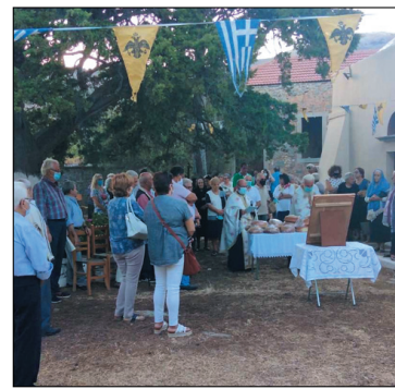
Στην Κεραπολίτισσα, κάτω από το γέριχο κυπαρίσσι, που βρίσκεται στον περίβολο της εκκλησίας.