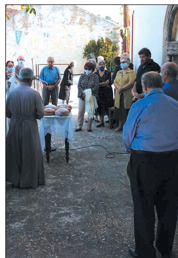
Στον Άγιο Ιωάννη τον Θεολόγο στο Πάνω Χωριό, εκκλησία του 17ου αιώνα, κατά την ευλόγηση των άρτων.

Πλήθος κόσμου και από τα τρία χωριά της Φουρνής μαζεύονται κάθε χρόνο, τόσο στον εσπερινό όσο και ανήμερα της εορτής, για να παρακολουθήσουν τις ιεροτελε-