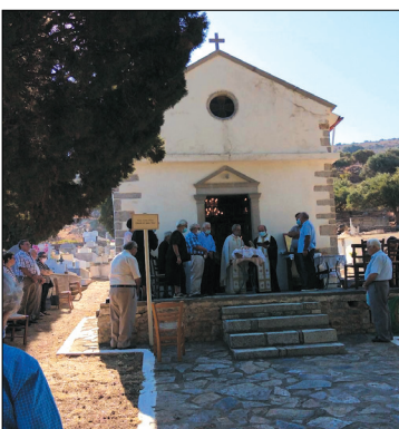
Στον Άγιο Τίτο, στο κοιμητήριο της Φουρνής, τις 25 Αυγούστου

Ο εσπερινός τελέστηκε στην Παναγία την Κουνέλα και η τελετή του επιταφίου και η λειτουργία ανήμερα της εορτής στο Επάνω Χωριό. Ακολουθεί η εορτή του Αποστόλου Τίτου, Νεκροταφειακού ναού του χωριού μας, όπου έγινε η καθιερωμένη ετήσια δέηση μετ' αρτιδίων υπέρ αναπαύσεως της ψυχής των προγόνων και λοιπών προσφιλών προσώπων μας. Επόμενη εορτή της καλοκαιρινής περιόδου είναι η γιορτή της Αποτομής της Τιμίας Κεφα-