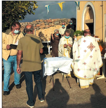
Στον Τίμιο Σταυρό, στην κορυφή του ομώνυμου λόφου, κατά την περιφορά και την ύψωση του Τιμίου Σταυρού.

λής του Αγίου Ιωάννου του Προδρόμου. Η εκκλησία βρίσκεται στο δρόμο προς το Νεκροταφείο.